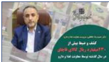
کشف و ضبط بیش از ۲۳ میلیارد ریال اقلام قاچاق توسط معاونت غذا و دارو دانشگاه در سال گذشته ۱۴۰۴/۰۲/۰۲