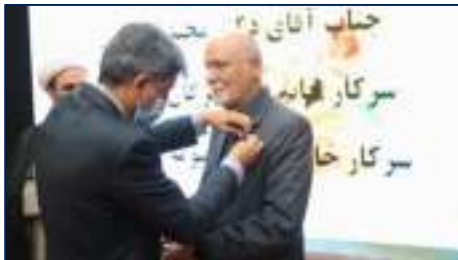
در مراسم بزرگداشت روز استاد دانشگاه علوم پزشکی استان سمنان،

علوم پزشکی استان سمنان برگزار شد ۱۴۰۴/۰۲/۲۳