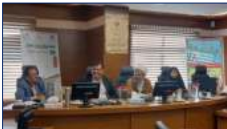
چهارمین مجمع سلامت شهرستان دامغان یا شعار «جوانی جمعیت یا اصلاح سبک زندگی» برگزار شد ۱۴۰۴/۰۲/۳۱