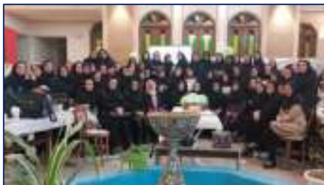
جشن بزرگداشت روز ماما توسط مرکز بهداشت شهرستان سمنان برگزار