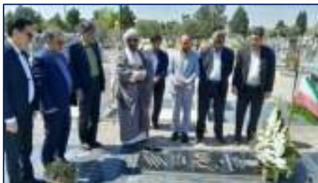
تجدید میثاق اعضای هیئت رئیسه دانشگاه با شهید مدافع سلامت دانشگاه به مناسبت هفته سلامت ۱۴۰۴/۰۲/۰۱