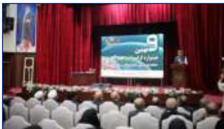
مراسم بزرگداشت روز استاد و جشنواره شهید مطهری در دانشگاه

علوم پزشکی استان سمنان برگزار شد ۱۴۰۴/۰۲/۲۳