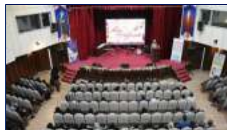
بیش از ۳۵۰ برگزیده دانشگاه علوم پزشکی استان سمنان در همایش خدمت ماندگار تجلیل شدند ۱۴۰۴/۰۲/۰۹