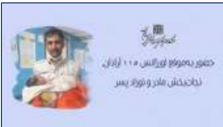
حضور به موقع اورژانس ۱۱۵ آرادان، نجات بخش مادر و نوزاد پسر